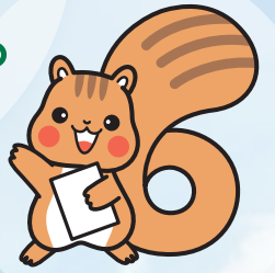
関節リウマチ疾患 啓発キャラクター